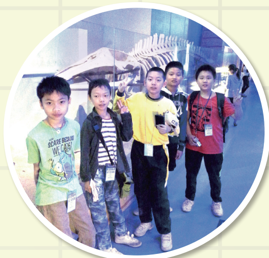
大家對館內的恐龍展品很有興趣