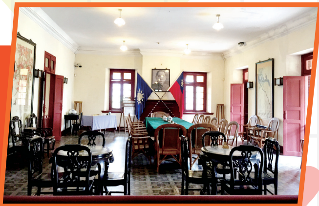
孫中山大元帥府內貌