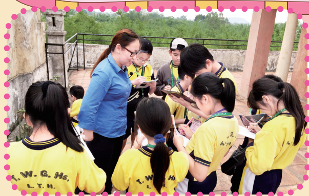
同學用心聆聽及做筆記