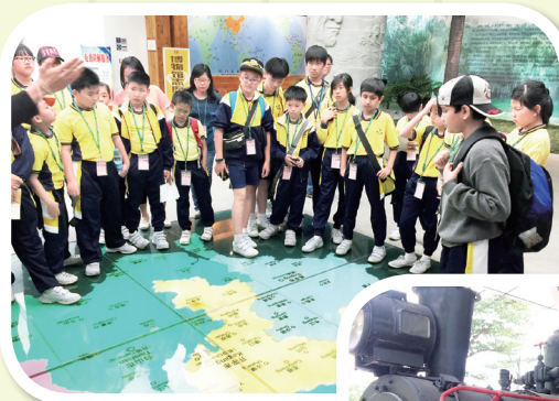
同學們專心一致聆聽導賞員講解

五邑華僑華人博物館是一所綜合性博物館。主要展示與五邑華僑華人相關的文物與資料，館內徵集所得的文物達三萬多件，其中三成為國家級文物精品。展館利用現代科技手法，採取聲、光、電等技術，配上恰當的場景製作，把華僑文物與歷史故事生動地展示於世人面前。