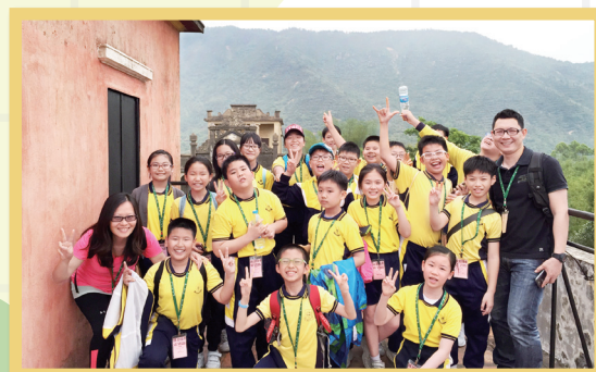
步上馬降龍碉樓樓頂