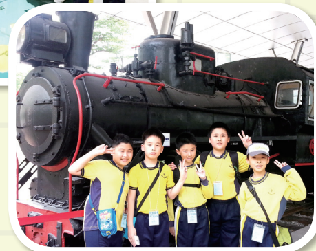
同學們於新寧鐵路列車前留影