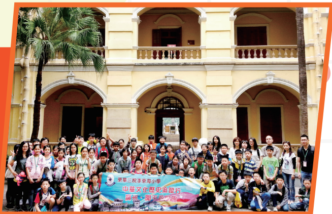
孫中山大元帥府外大合照