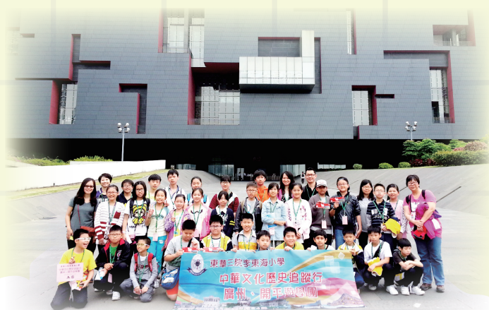
廣東省博物館外大合照

廣東省博物館於1957年開始籌建，1959年10月1日，正式對外開放。展館舉辦各種形式和題材的陳列展覽，努力向社會提供豐富、優質的公共文化服務，在藏品收藏保管與科技保護、陳列展示、科學研究和教育推廣等方面，都取得了發展和成果。2003年廣東省委、省政府決定興建廣東省博物館新館，並將其作為廣東省重點文化建設項目和建設文化大省三大標誌性文化設施之一。新館展館分為歷史館、自然館、藝術館和臨展館四大部分。