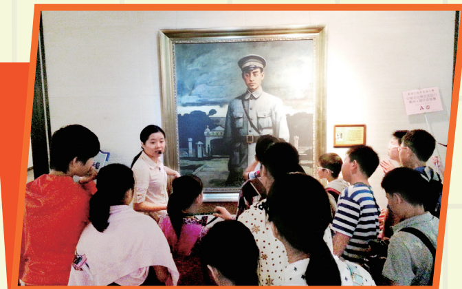
同學留心聆聽導賞員講解

孫中山大元帥府紀念館是依託廣州孫中山大元帥府舊址籌建的人物紀念館，為國家二級博物館。館內設有《帥府百年》復原陳列、《孫中山在廣州三次建立政權》基本陳列、《帥府名人》、《民國廣州》、《帕內在廣州建築史跡》和《帕內眼中的嶺南》等長期展覽。2001年修葺後的「大元帥府」以嶄新的面貌重新對外開放，每年慕名而來的海內外遊客絡繹不絕。